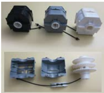
Les nouveaux culbuteurs 12 pour installations à gauche et/ou à droite.